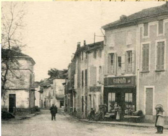
Place Viçose, Girou, qui déménagea en 1909 route d'Aiguillon, avant de devenir Arcas.

Et parfois même, l'épicier vendait de l'essence dont la couleur rose montait et descendait dans les vases au rythme des coups actionnés de la pompe.