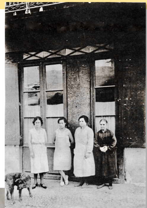
Rue Gambetta, épicerie Raynal