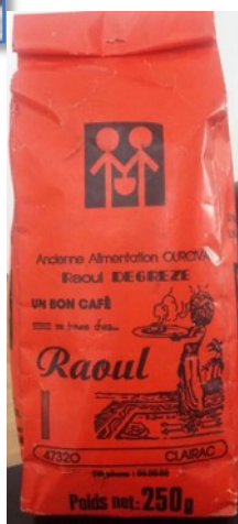
À Longueville, l'ancienne épicerie Ourcival, devenue l'enseigne Codex.

Que ne trouvait-on pas chez Tichit, rue Gambetta ? Fruits, primeurs, mercerie, quincaillerie, vins à emporter nous annonce leur pochette... mais que d'autres trésors encore !