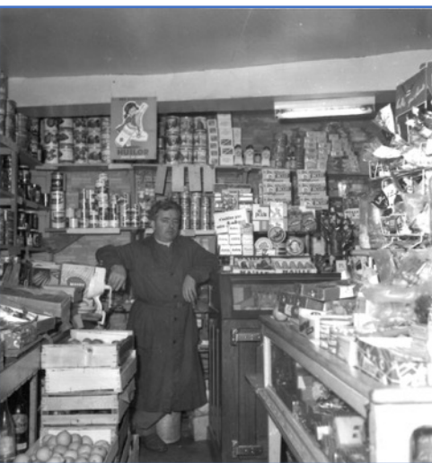
En 1961, Bessou, rue Jean-Jaures