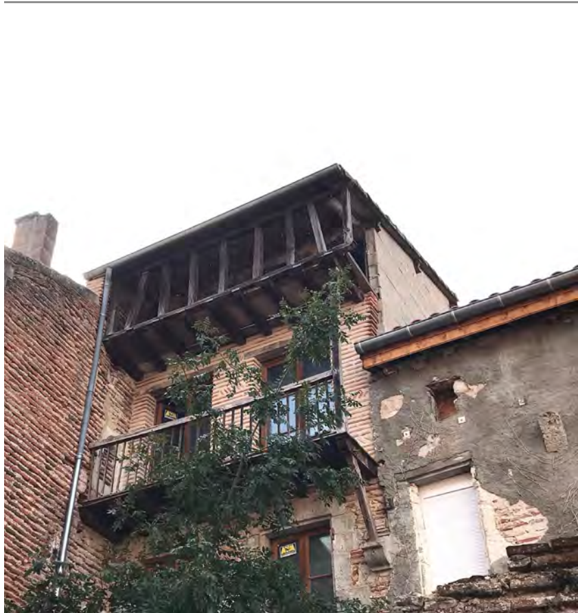
Orientée à l'Est, cette galerie située au revers d'une maison de la rue des Couteliers reste protégée des regards...

La plus fastueuse existe toujours : celle de l'abbaye, exposée plein sud, qui domine la vallée du Lot !