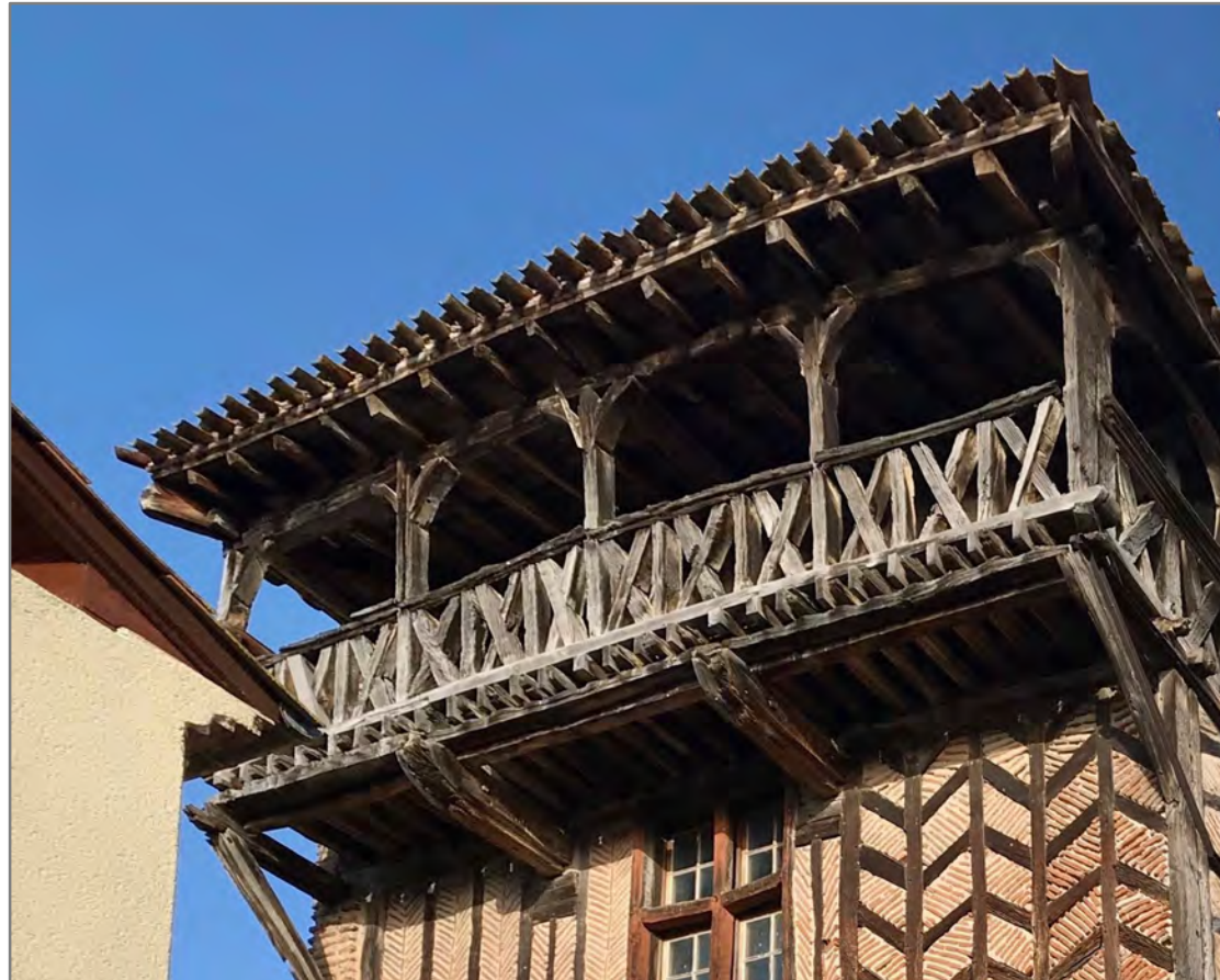
Orientée plein sud, la galerie du musée domine le village et la vallée du Lot.