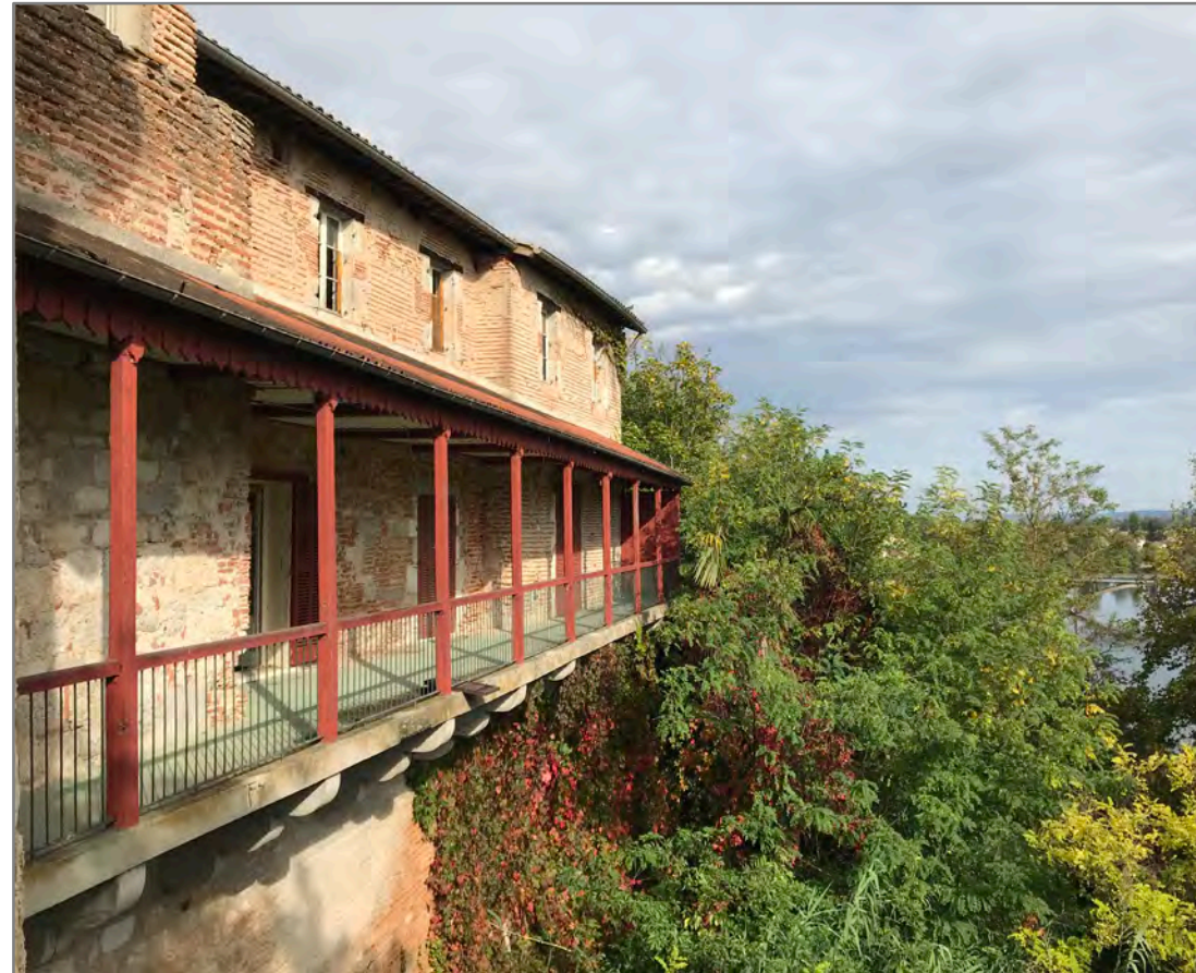
Remaniée dans les années 1980, la galerie de l'abbaye.