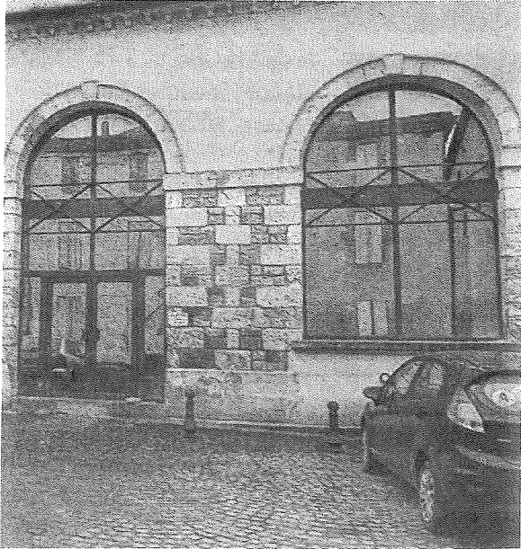
« la halle de Clairac ».