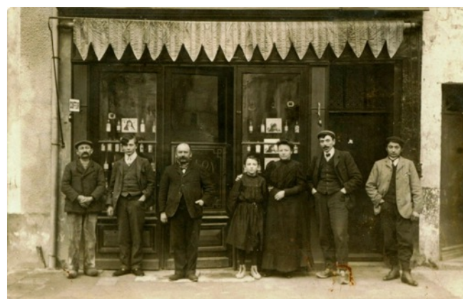
Qui saura où était installé ce coiffeur, et ses publicités de Pétrole Hahn ?