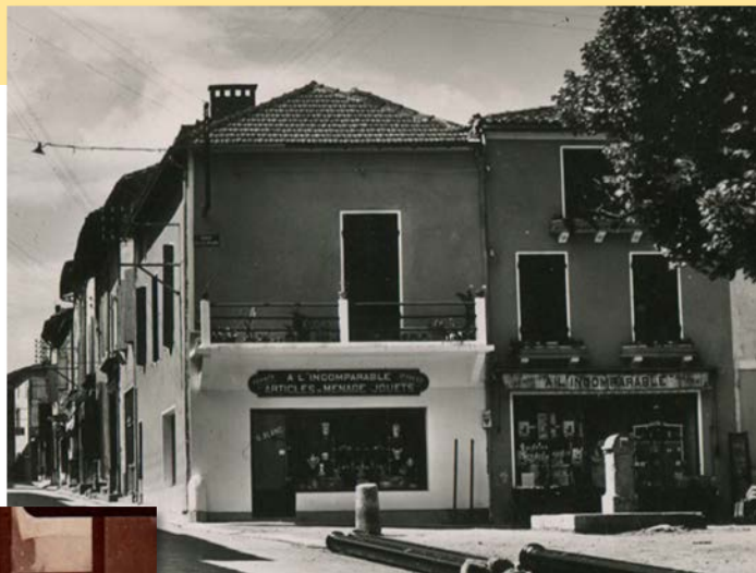
Place A.-Briand, À l'Incomparable