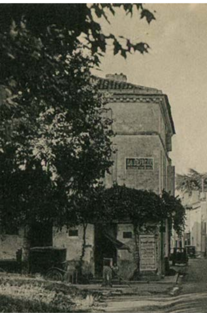
À La Pause, le dépositaire de La Dépêche , et Roussannes, place Serres